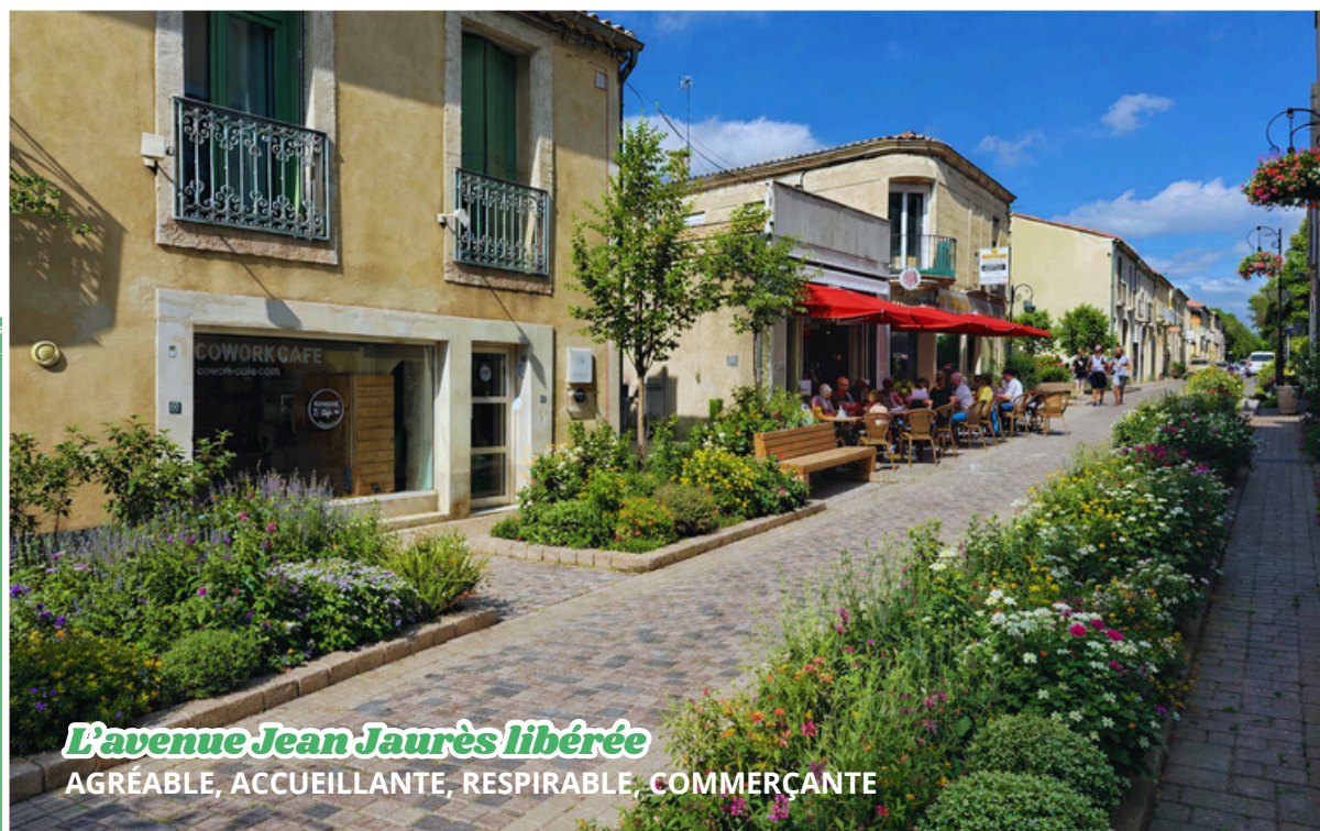
L'avenue Jean Jaurès libérée

Renforcer le lien entre les quartiers et créer des moments conviviaux en valorisant le partage et les valeurs du sport.